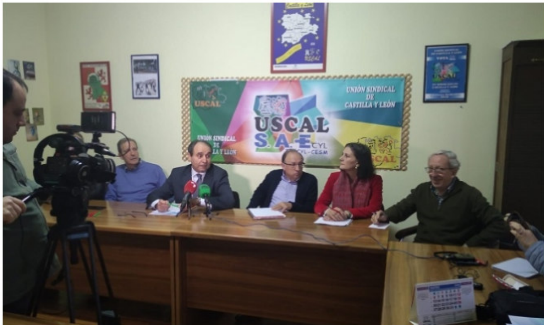
Rueda de prensa de USCAL, esta mañana en León.

USCAL movilizará a los 85.000 empleados públicos de Castilla y León por el desarrollo de la carrera profesional con efectos desde el 1 de enero de este año, y recuerda que han pasado casi trece años desde que está regulados en el Estatuto del Empleado Público.