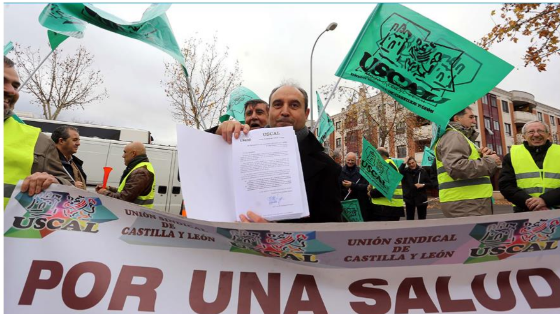
Una concentración anterior convocada por Uscal.