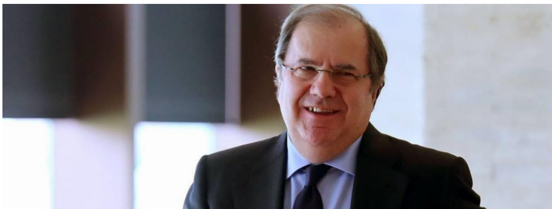
Juan Vicente Herrera, presidente de la Junta de Castilla y León.

Tras reunirse la junta directiva de la Unión Sindical de Castilla y León (USCAL) han confirmado que los 2.000 sanitarios de Castilla y León que desarrollan labores de salud pública y seguridad alimentaria, entre los que se encuentran los veterinarios, irán a huelga el próximo 15 de noviembre