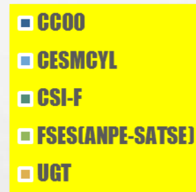
PRESENTES EN LA MESA SECTORIAL SANIDAD